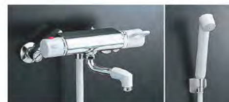
■ サーモ付シャワーバス水栓 BF-HE147T (INAX) スプレーシャワー