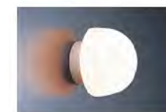
■ 照明: 半球型白熱灯 LW-B6-5A (昭和電気産業)