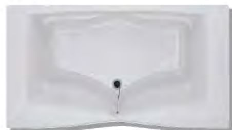
B-1200P MW1 (3方IPON付) (INAX)