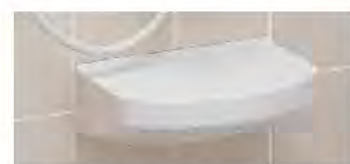
■ 洗面器台 LUD-4025A(1)/N86 (INAX)