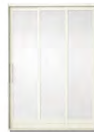
■ 浴室3枚引き戸 18-20 (樹脂パネル) (トステム)