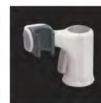
■ シャワーフック R29-30 (リライズ)