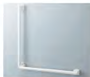
■ アクセサリーバー I 型 NKF-510(600/800)/WA (INAX)